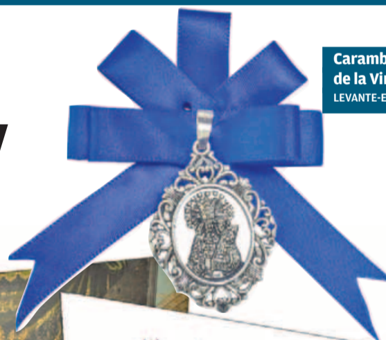
Caramba de la Virgen.

Himno de la coronació de la Mare de Déu dels Desamparats