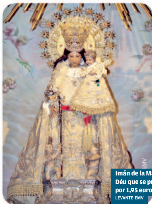
Imán de la Mare de Déu que se puede adquirir por 1,95 euros.

Levante-EMV ofrece a sus lectores hasta tres promociones especiales con motivo de la festividad de la Mare de Déu dels Desamparats. Estos días ya se publicará la publicidad para adquirir la Caramba de la Virgen por solo 3 euros más el cupón de reserva. También mañana sábado, 12 de mayo, se distribuye un imán de la patrona de los valencianos por 1,95 euros, apto para colocarlo en la nevera y otras superficies imantadas y susceptibles de ello. Y por último, este domingo, día 13 de mayo, se regala la lámina de la Mare de tots els valencians que representa la obra de Vicente Requena, del siglo XVIII, que se halla en el MUMA de València y que fue captada por el fotógrafo José Aleixandre. En el anverso figura el Himno de la Mare de Déu.