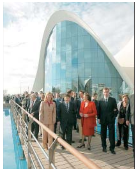
DISEÑOS. Loas frente a las cubiertas de Candela. M. MOLINES