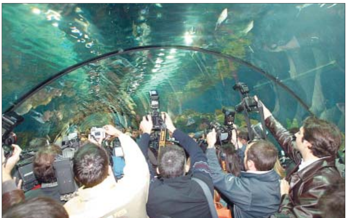
BAJO EL TÚNEL. Cerca de 300 periodistas se acreditaron para cubrir el acto de inauguración. MANUEL MOLINES

■ El Consell de Zaplana modificó el proyecto del PSPV, más modesto económicamente